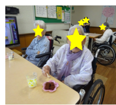
美味しかったです

料理教室を行いました。今月は「チョコレートケーキ」を作りました。ご利用者は、材料を混ぜる等の作業をして頂きました。作業中は皆様笑顔を見せられ楽しそうな様子が見られました。おやつの時間に召し上がられ、美味しかったと言って頂きました。