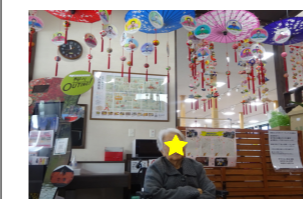
さげもん綺麗でした

バスハイイクで柳川のよかもん館にひな飾りを見に行きました。豪華なひな飾りや色々なさげもんをご覧になられ「きれいかね。」と笑顔を見せられていました。