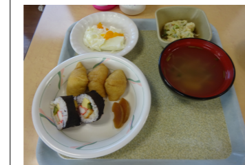
昼食 巻き寿司ちいなりずし