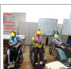
おめでとうございます