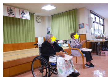
皆様、おめでとうございます。