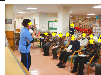
ご挨拶、ありがとうございました。