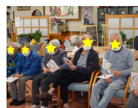
ゲームで楽しみました

ひな祭りの行事を行いました。今年の大川荘お雛様は、7段飾りを2つと2段飾りを1つ、さげもんを増やして飾りました。また、外部の方よりお布団の飾りも頂き、大変晴れやかになりました。その後、ひな祭りゲームなど行い、皆様と楽しみました。