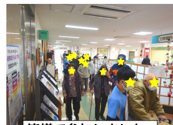
皆様に参加しました