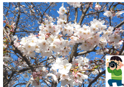
「大川荘敷地内の桜です」