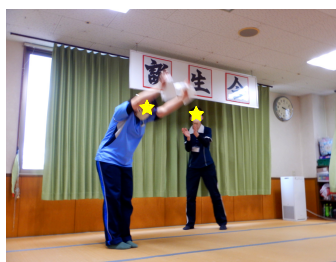
職員の出し物です！

3月の誕生会を行いました。3月は9名の方をお祝い致しました。おめでとうございます。ハッピーバースデーの歌でお祝いした後、職員の出し物を披露、〇×クイズや言葉遊びゲーム、椅子取りゲーム等を行いました。