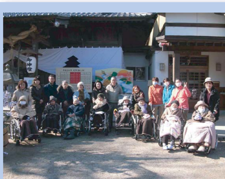
ご家族様も一緒に、記念写真☆ 良い一年のスタートが切れました！