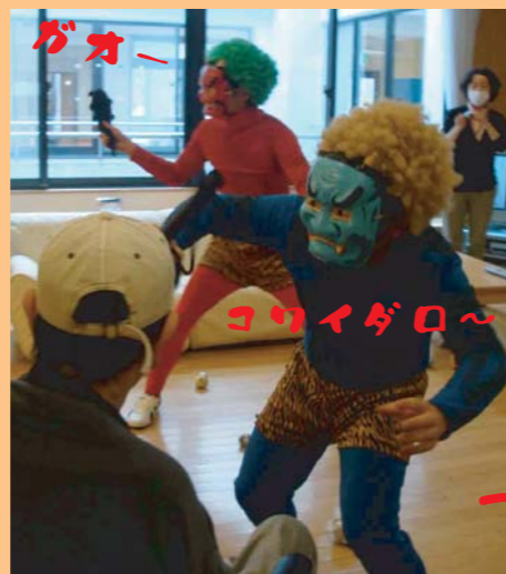
最初は勢いのあった鬼たちも、みなさんのお陰で・・・