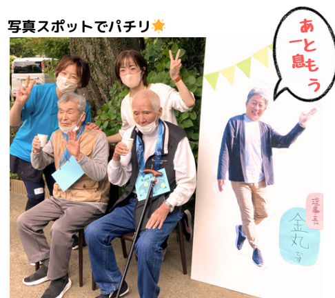
写真スポットでパチリ★

4月の春日和に、おきなのだの3つのデイサービス「いきがい元氣塾」、「やりがい文化村」、「OKINAdARUKU」合同で、ウォークラリーが開催されました。開催の目的は、ご利用者様に楽しく歩いていただき、デイサービス同士の交流を図ることです。おきなのだの広～い敷地内をチームに分かれて、スタッフが付添いサポートいたします。途中、休憩ポイントが設置されていて、スタンプを押してもらい、水分補給やチョコで栄養を補給しながら、スタッフと共に写真撮影を楽しんでいたら、あっという間にゴールへ到着！次回もご参加お待ちしております。