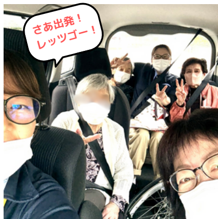
車でドライブです★