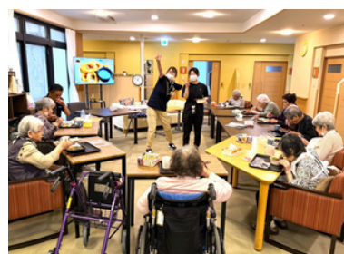
戻ってきてからの昼御飯が美味しかったそうです！

この日は「サンリブシティ小倉」へ各自フードコートで好きなものを召し上がったり、ショッピングを楽しんだようです♪ ショートステイでは、滞在中ワクワクできる「おもてなし企画」をご用意しています！