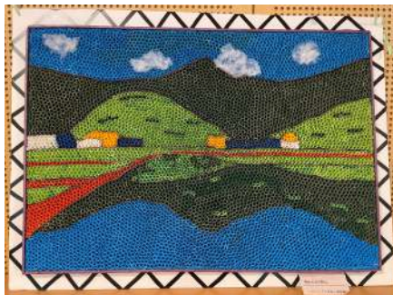
タイトル：晴れた日の貴山