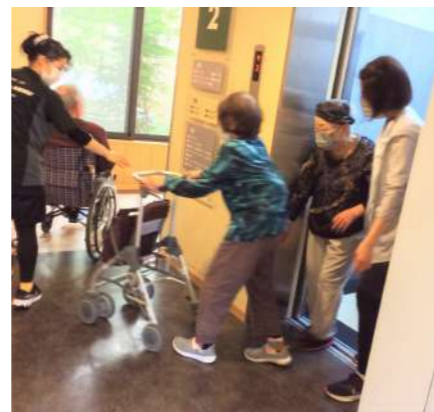
皆様とても前向きに、そして積極的にご参加いただきました！超感謝です！！