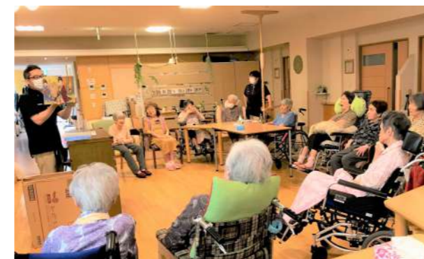
おやつが出来上がるまで、紙芝居をお楽しみくださいー！

特養2・3丁目のおやつ企画は、調理中に住民様が手持ち無沙汰にならないように一工夫しました！