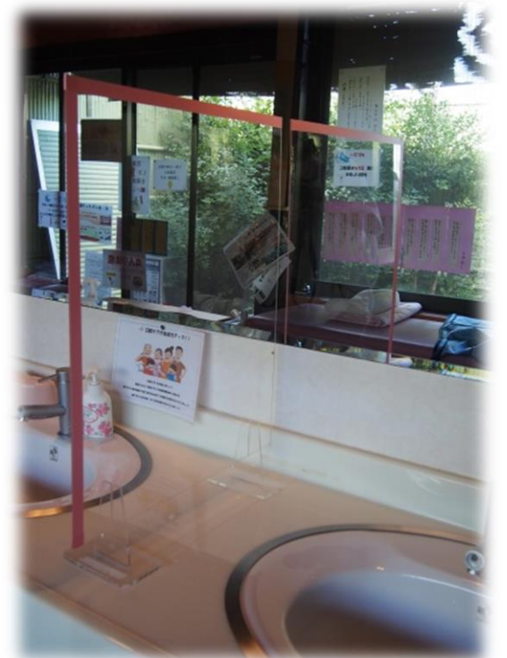
各洗面台にアクリル板