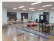
機能訓練室 (デイサービス)

敷地内に併設した通所介護を利用することにより、入浴機能訓練などのサービスが受けられます。(介護保険利用)