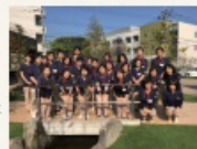
訪問看護ステーション

敷地内に併設した訪問看護事業所を利用することが出来ます。(介護保険・医療保険利用)