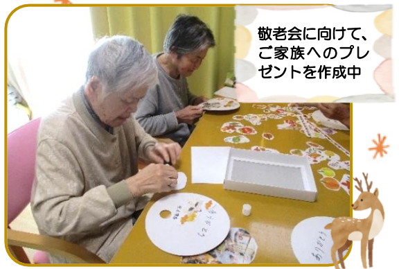
敬老会に向けて、ご家族へのプレゼントを作成中