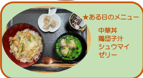
★ある日のメニュー