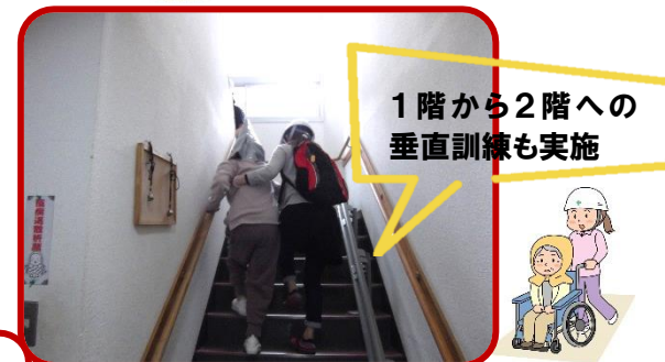
1階から2階への垂直訓練も実施