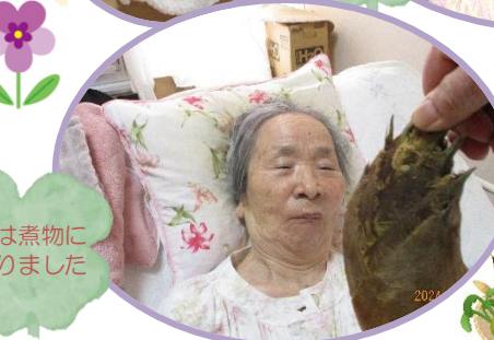
苟は煮物になりました