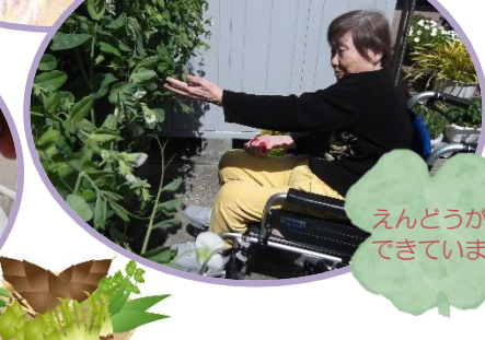
えんどうができています