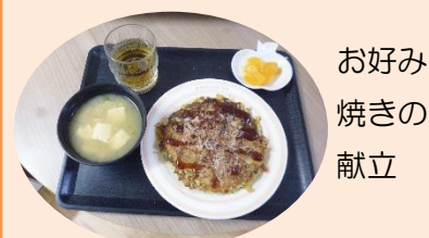
お好み焼きの献立