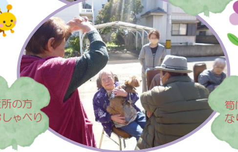
ご近所の方とおしゃべり