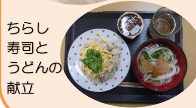
ちらし寿司とうどんの献立