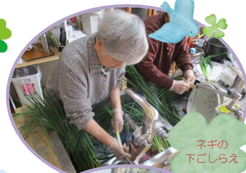
ネギの下こしらえ

桜が満開になり見物にでかけました。鏡野公園、西川花公園等。いつもは物静かな入居者さんも、「綺麗に花が咲いちゅうね」と嬉しそうに話されていました。