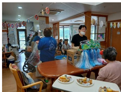
夏祭り！みんなで、浴衣を着て ゲームや盆踊り！