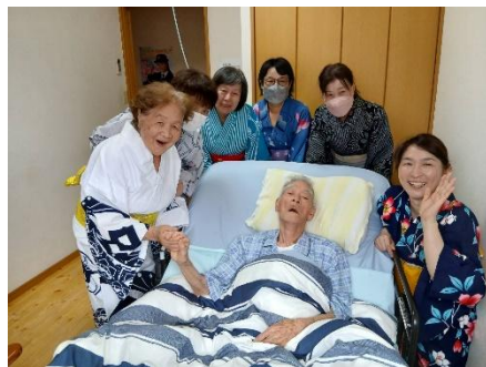
サマリヤの家に サプライズ訪問！