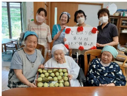
毎月一回の手作り会 今月は、よもぎまんじゅう。