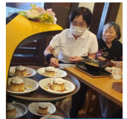
ほーむ食事も ロボットが担