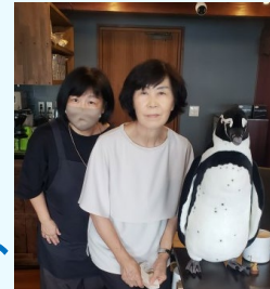
ソフトなママとペンギ