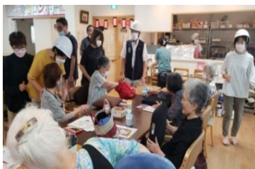
9/1 今治シェイクアウト訓