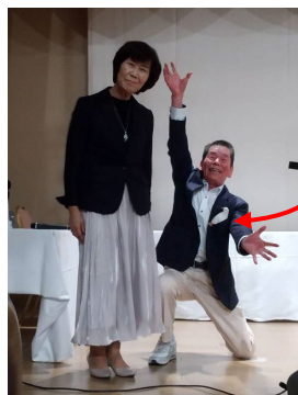
懇親会ピーちゃんも出席