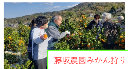
藤坂農園みかん狩り