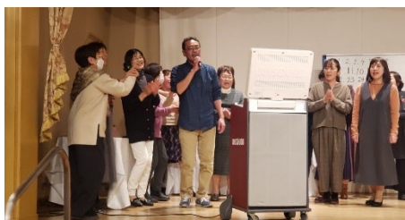
懇親会 みんなで歌を（国際ホテル）