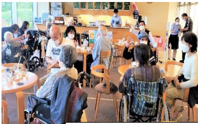
お芋ほり & コーヒーブレイ