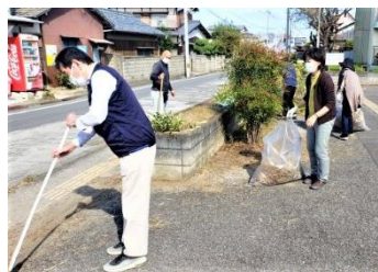
選挙前 集会所周辺清掃