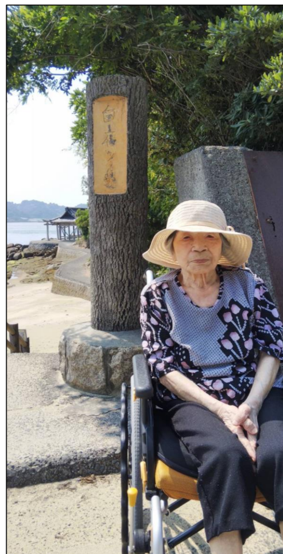
白石/鼻めぐり 松山市高浜6丁目