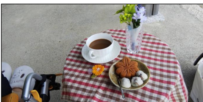
ティータイム🍵 もみじ饅頭・薄皮まんじゅう