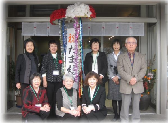
《11/21 開所式がありました》