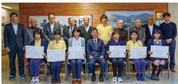
勤続25年表彰式を行いました。