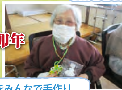
干支の置物をみんなで手作り