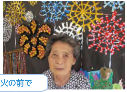
夏、華麗な花火の前で