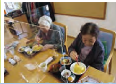
可愛いハロウィンメニューに舌鼓