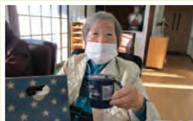
ビンゴゲームで当たったよ～