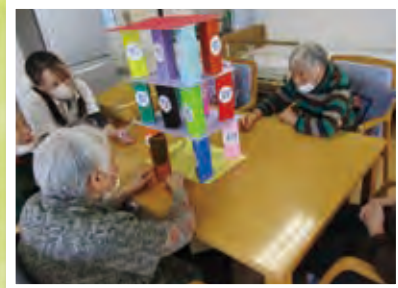
2022 年も色々なレクを楽しみました