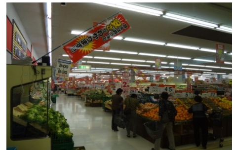
新鮮・安全な野菜が並ぶコーナー