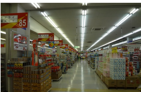
なんでも揃う多彩な日用品コーナー

「買えば買うほど安さ分かる」 …お客様がそう言ってくださるよう頑張っていきます。