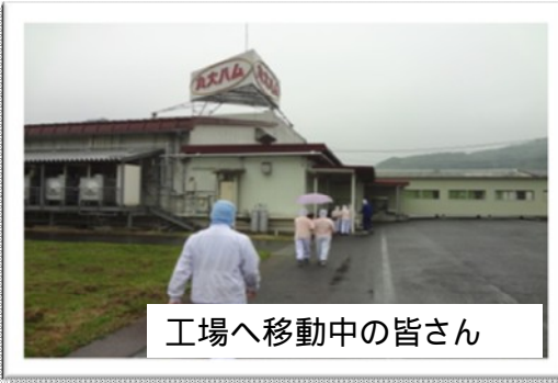
工場へ移動中の皆さん

今回職場訪問して感じたことは、食品を扱っている工場ということ、衛生にずいぶん気を付けられていることです。工場に入る前の衣服の交換、衣服のごみ取り、手洗い(しっかりと)そしてエアー集塵室を通りやつと工場へ。その中で皆さんきびきびと働いておられました。