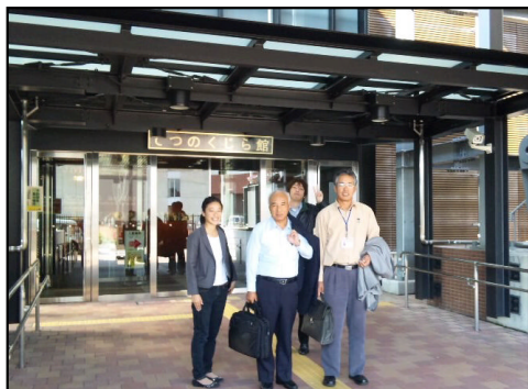
大和ミュージアム

内容としては、関係行政機関より情報提供が行われた後、各圏域のセンターより状況報告が行われました。昨年度より、広島県では全国平均を上回る障害者の就