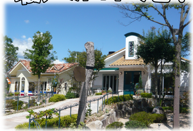
ゆったりとした時間が流れるレストランすずらんとパン工房ラ・パン

すずらんを 訪ねて... このたび障害をお持ち の人を受け入れていただ いている「レストランす ずらん」(三次市)のオー ナーである今福さんに障