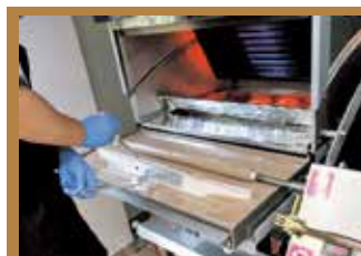
じっくり時間をかけて 焼き上げます