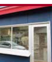
おしゃれな販売スペース