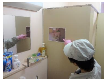
洗面台に並べる品の写真

仕事を始めてよかったことは、自分で使えるお小遣いが増え、携帯代も自分で支払えることです。