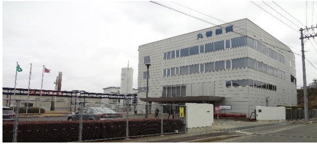
丸善製薬三次工場事務棟

発行所 三次市十日市東三丁目 14-1 三次市福祉保健センター1F 一般社団法人備北地域生活支援協会 備北障害者就業・ 生活支援センター TEL. (0824)-63-1896 発行人：谷口光治