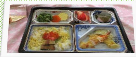
ビールは最高じゃ