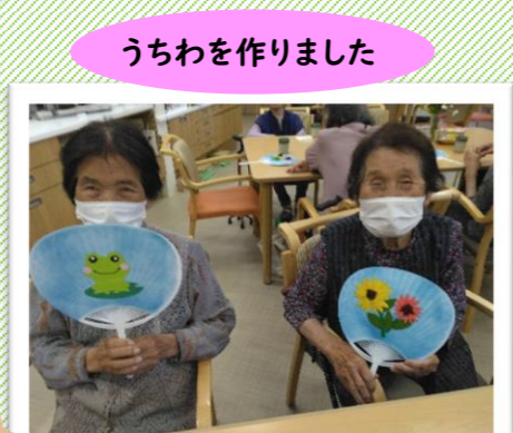
うちわを作りました