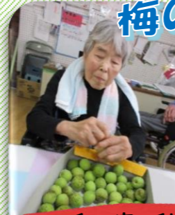
和の家の利用者さんが収穫した梅のヘタ取りをしました。