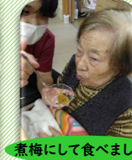
煮梅にして食べました