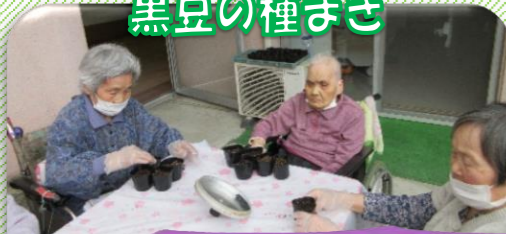
発芽し、立派な苗ができました。収穫が楽しみです。