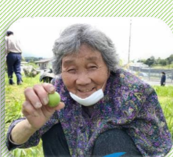
梅がたくさん採れたよ!!