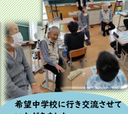
希望中学校に行き交流させていただきました。