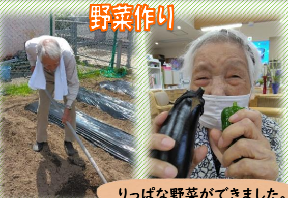
りっぱな野菜ができました。