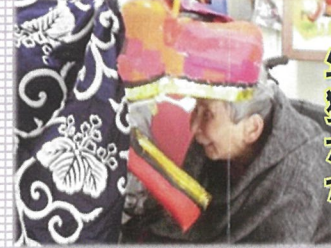
年始の 獅子舞☆ 大きな口で ガブリ♪