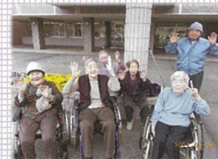
春のお散歩♪ 気持ちよくてばんざーい！！