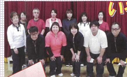
おもてなしの心で 良い介護♪