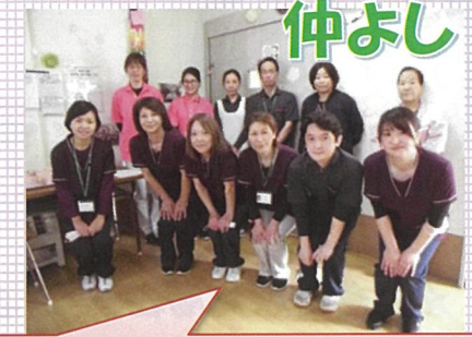
初心！ 忘るべからず！