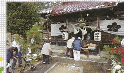
和の家から近い神社に初詣へ行き、健康祈願をしました！