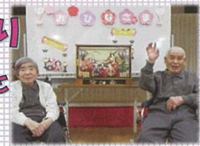
お内裏さまと お雛様♪