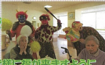
鬼は外！！ 福は内♪ 利用者の皆様に福が来ますように