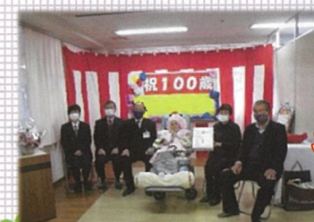
おめでとう ございます！！