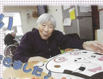
とても お上手にできました♪