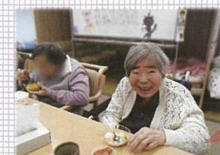
2月の誕生会では、該当の利用者さんを囲んでおしゃべりをしながらプリンを食べていただきました♪