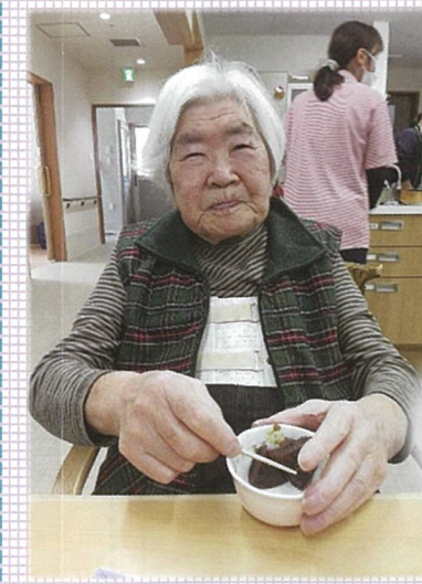
ひな祭り会では羊羹とお抹茶をお出しして喜んで頂きました♪

賀陽荘和の家は吉備中央町賀陽圏域で初めてとなる事業所として開設させていただきました。職員自身も初めて経験することもあり、試行錯誤しながら2年目を迎えることができました。「訪問・通い・泊り」の柔軟な対応ができることで特に「一人暮らし・高齢者世帯」の方からは好評をいただいております。今後も利用者及び家族が少しでも安心して地域で生活できるように柔軟に対応してまいります。