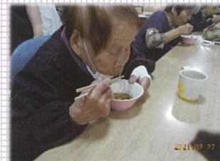
介護クッキング ラーメン！！

ご利用者様・ご家族様、地域の皆様にはいつもお世話になりありがとうございます！ 令和3年4月から、より明るく優しい気持ちで利用者さんの思いに寄り添い、「デイサービスに今日も来て良かった！！」と言っていただける様、通所と居宅介護支援のサービスの充実をはかり、職員一同力を合わせて頑張りますので今年度もよろしくお願いいたします☆