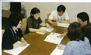
居宅介護支援事業所