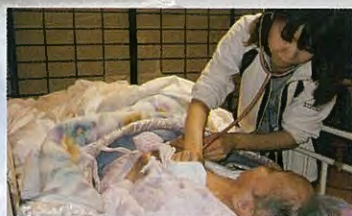
訪問看護ステーション

介護老人福祉施設(従来型) 短期入所生活介護 通所介護 訪問介護 訪問入浴介護 訪問看護 居宅介護支援