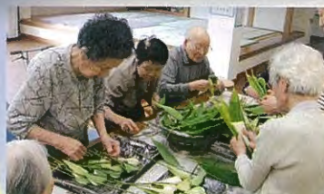
デイサービスセンター