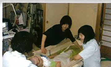
訪問入浴介護事業所