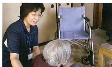
ホームヘルプセンター