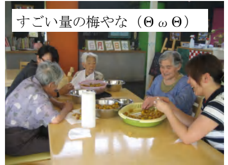
雨 降らんのかあ・・・?

東棟は6月頃はちょっぴり忙しいんです。右の写真は大量の梅の掃除をしているところ。梅ジュースや梅干しを今年も作りました。いろいろすることはありますが、縁側でちょっと休憩することも。