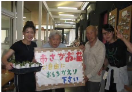
(ちなみに3個程どなたかもらってくれました↑)

暑い夏は中庭で取れた夏野菜を食べて乗り切るぞ!! 茄子・ピーマン・ミニトマト・ツルムラサキがどんどん出来てきます。そして何故か朝顔もたくさん出てきたので道路側に置いてみました