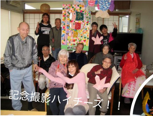
記念撮影ハイチーズ！！

♪ 屋根よ〜り高い鯉のぼ〜り〜♪ 紙粘土やフェルトを使用して、みんなでワイワイ楽しく協力しあって作った鯉のぼりです。出来映えはいかがかしら？