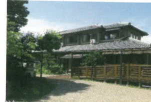
【北側】 より愛どころありがとう