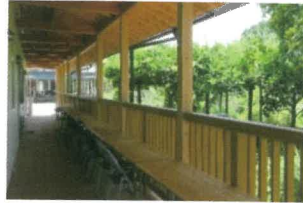
すべての施設は敷地中央の道でつながっています