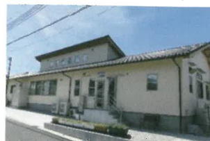
【中央】 しんしんリハビリテーション 菜の花