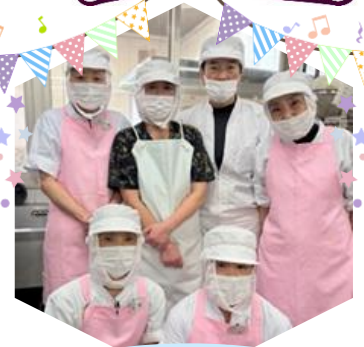
給食を作ってください 浅田給食の皆さん

ぶりの照り焼き 伊達巻き れんこんの煮物 鶏肉の照り焼き 花しんじょう 大根なます 寿高野豆腐・木の葉 南瓜・六角里芋・金時 人参の煮合わせ 栗の甘露煮