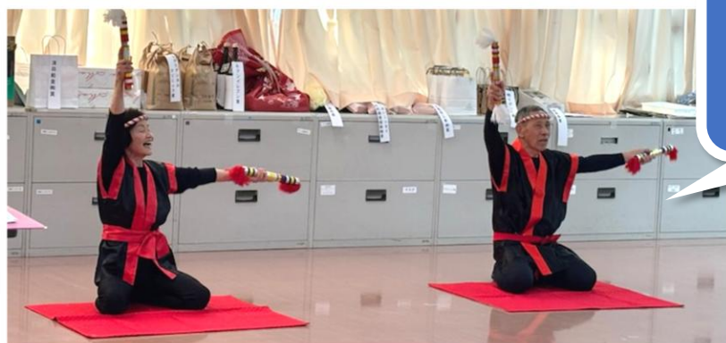
芸能同好会による 息ぴったりの 「銭太鼓」