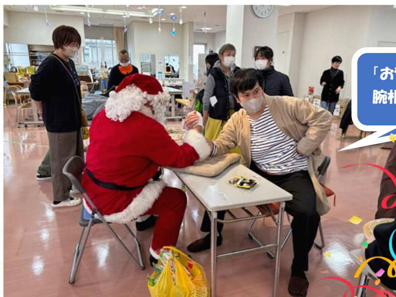
「おやおや・・・怪しいサンタと 腕相撲！みんな真剣です！」