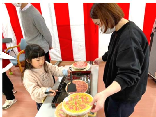
お好み焼き(!?)による リハビリアトラクション