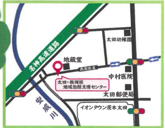
西国街道沿い地蔵堂の大きな木の向かい側