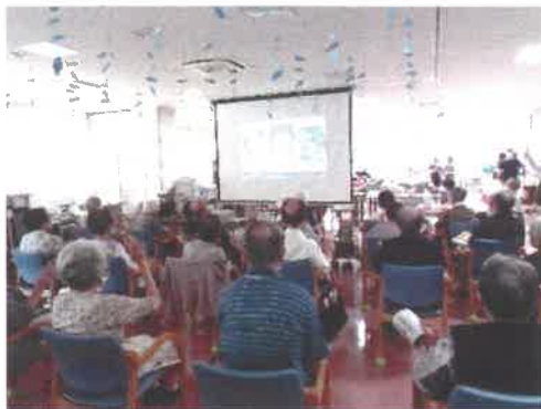
●茨木警察署のイベントの様子●