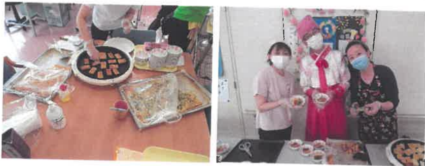
●手作りチヂミ週間の様子●