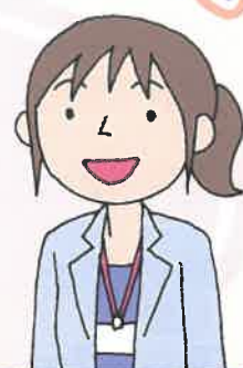
主任 ケアマネジャー

地域包括支援センターは、地域で暮らす高齢者やそのご家族等を、介護・福祉・健康・医療・くらしなどさまざまな面から総合的に支えるために設置されています。保健師または看護師、社会福祉士、主任ケアマネジャーが協力して、高齢者等を支援します。いつまでも住み慣れた地域で安心して生活していけるよう、相談からサービスの調整に至るまで一つの窓口で支援します。