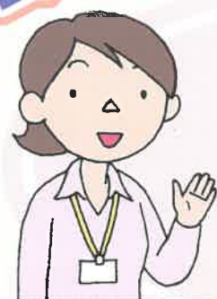
保健師 または看護師