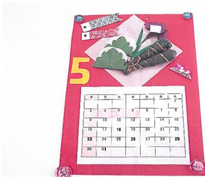
●5月度の手作りカレンダー●

デイルームでは極力、マスクの着用をお願いいたします。また送迎車内での検温と手指消毒のご協力もお願いいたします。