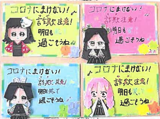
（高齢者からのお礼のお手紙・・・）

手紙には、子ども達が描いた絵や折り紙なども添えられており、受け取った高齢者からは、子ども達にお礼の返事を寄せられる方もおられます。