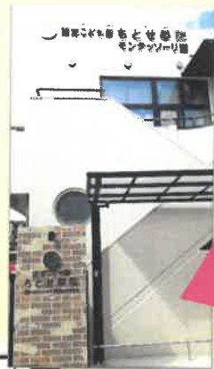
モンテッソーリ教育を唱えた學院