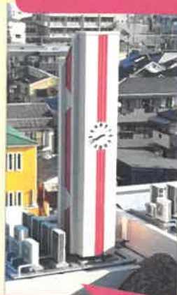
シンボルマークの時計塔