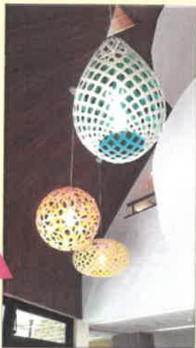
玄関フロアを明るく照らす デザイン照明のイルミネーション