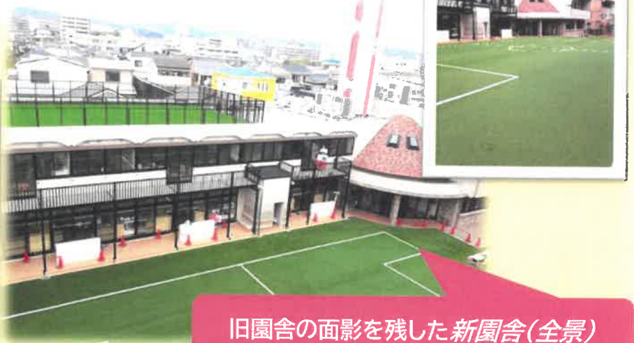
旧園舎の面影を残した新園舎(全景)