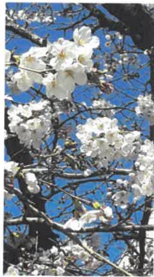
開園当初からあるソメイヨシノの桜も完成を祝ってくれています