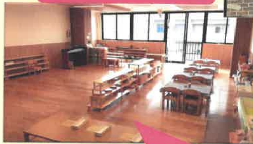
木の温もりを感じる保育室