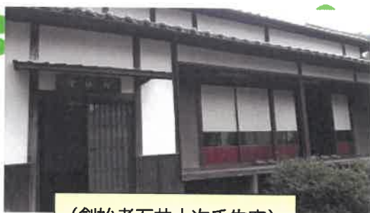
(創始者石井十次氏生家)

当法人も認定こども園3園を運営しており、健全な子どもの養育に全力投球しております。また、ちとせ学院には、スマイルサポーターを配置して、子育て相談等にも対応しております。