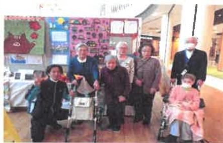
●作品展示での様子

*11月にお願いをしておりました、送迎車入れ替えに伴い必要となる、障害者手帳のご持参のご協力ありがとうございました。