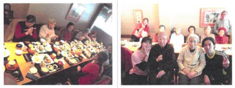
●お食事ツアー[木曽路]で ハイ！チーズvv

メニューは4種類の定食から選び、高級感のある個室で～素敵なひととき～を提供して頂いた[木曽路]さん、ありがとうございました。また次回のイベントも乞うご期待！