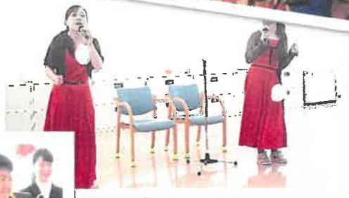
ザ・ピーナッツ?! 息の合った 二人の歌声～、素晴らしい!