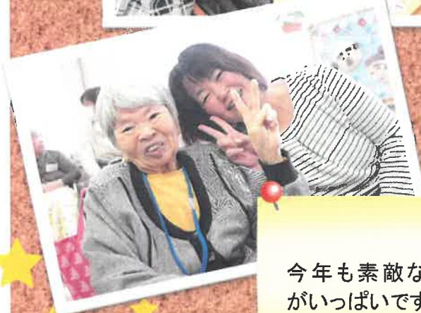
今年も素敵な笑顔 がいっぱいです。