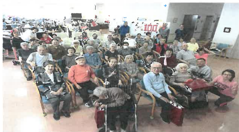
●デイサービス敬老会での集合写真●