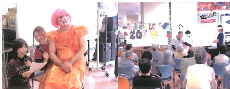
●かくし芸大会の様子

また1月26日(金)には「新春！かくし芸大会」を実施し、施設全体での初笑いとなりました。今年もさまざまな楽しいイベントを企画していきますので楽しみに！！