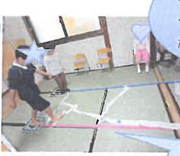
機械からこうやって出てくるんだ～