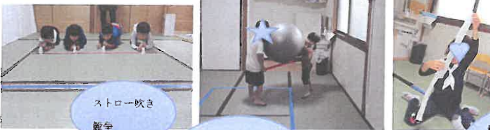
ストロー吹き 競争