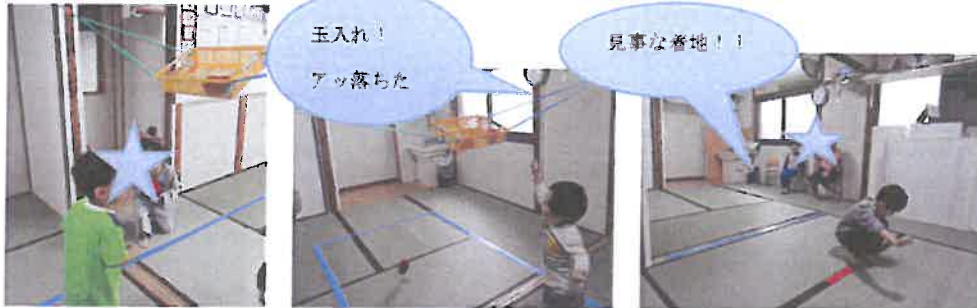
玉入れ！ アッ落ちた