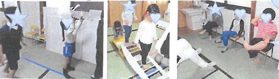
ちぎった紙で迷路を作ったよ