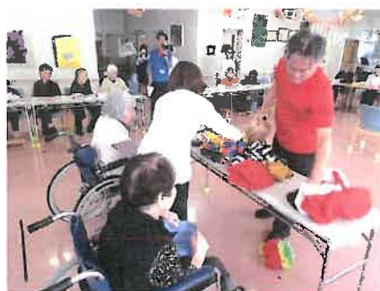
●デイサービス秋の大運動会の様子