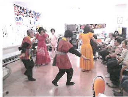
●《ぶどうの会》の皆様によるイベント