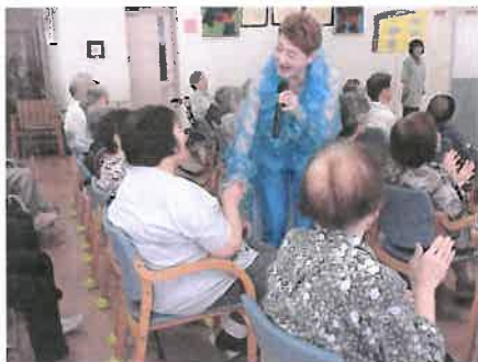
●元宝塚の方によるイベント

先月は13日(木)に「ぶどうの会」の皆様による盛り沢山の出し物(フラダンス、マジックショー、ピアノ演奏など)を披露いただき、25日(火)には元宝塚の方による歌謡ショーでデイサービス全体が、まるで宝塚劇場のような雰囲気になり、利用者様共々、おおいに楽しませていただきました。