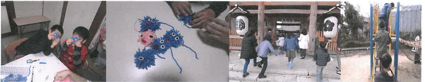
毛糸をつかってぼんぼんづくりをしたり・・・時々総持寺へ遊びにおでかけしたりもしています。