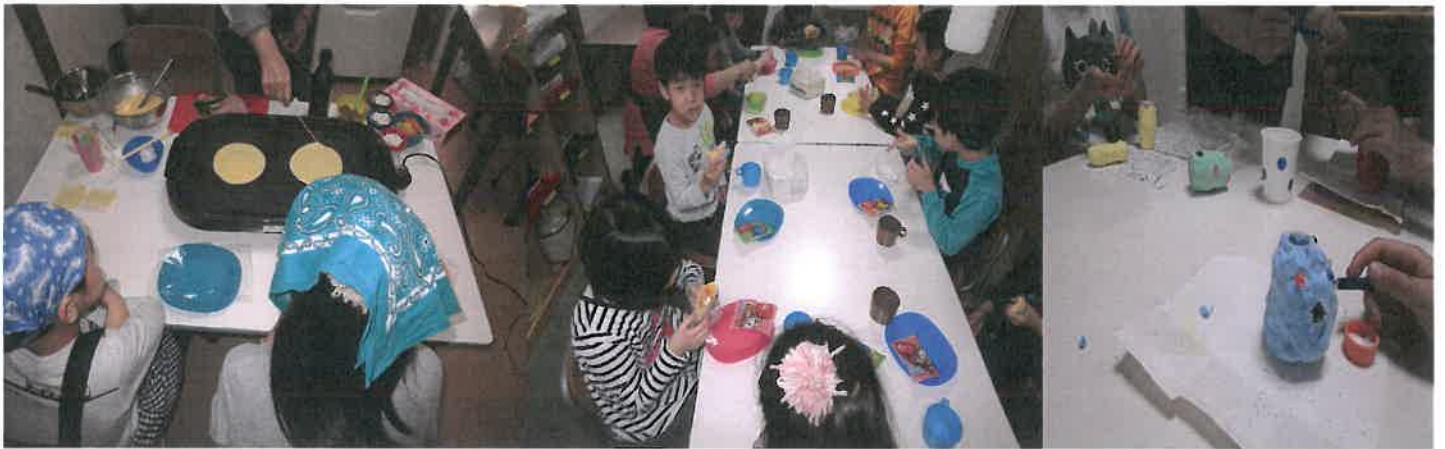
春休みのクッキングはクレープづくりをしました。おいしく頂きました！ 粘土の花びん制作風景☆