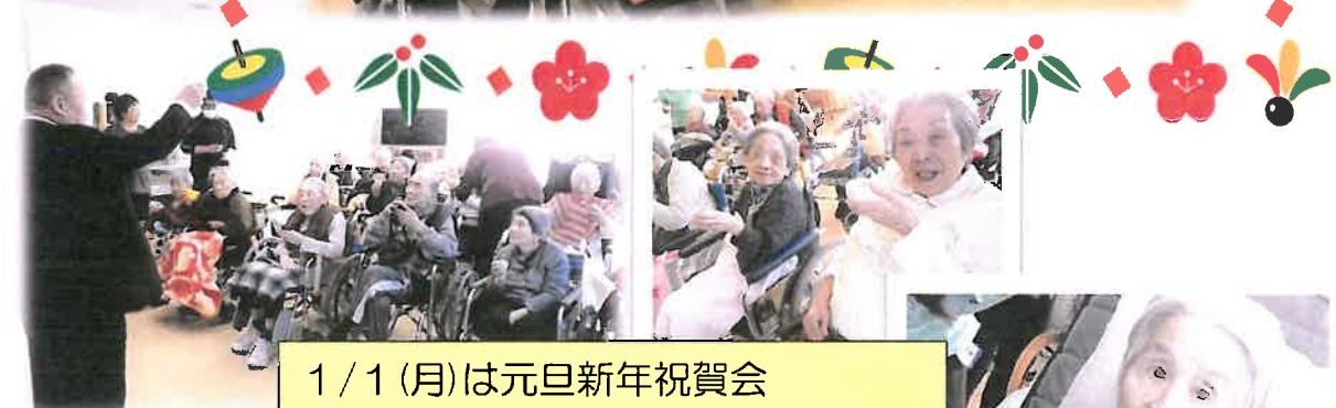
1/1(月)は元旦新年祝賀会 恒例の甘酒での乾杯に笑顔満載!!