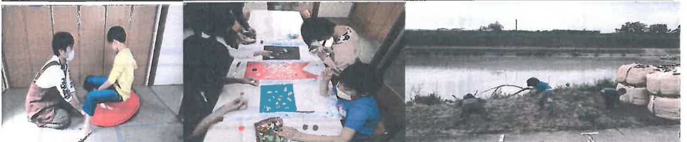
バランスとってます

その他では河原に遊びにいたり・新しい遊具も入りました。 これからも日々子ども達と楽しんですごしていきたいとおもいます。