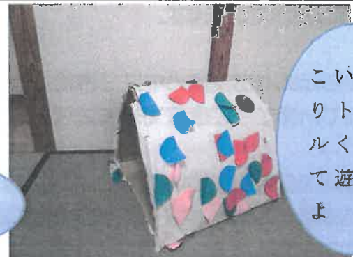
こいのぼりトンネルくぐって遊んだよ