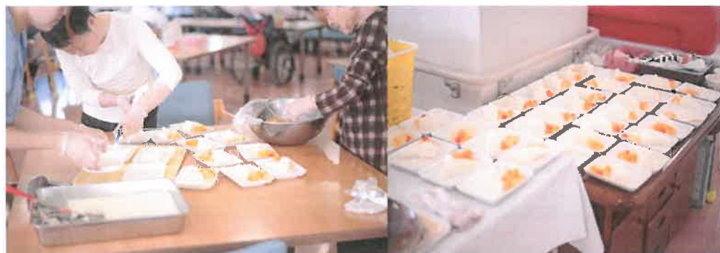
●スノーボールクッキー

5月9日(月)～14日(土)の週にて、ご利用者様と一緒に手作りおやつを作りました。月・火・水はスノーボールクッキー、木・金・土はヨーグルトケーキと2種類のおやつを作成しました。スタッフよりご利用者様の方が手際よく動かれ、とても勉強になりました(笑)