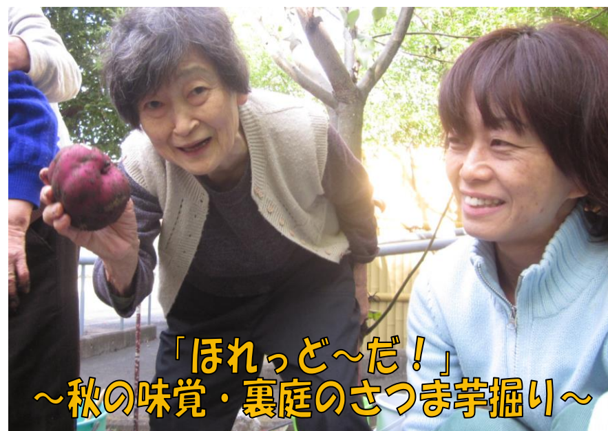
「ほれっど〜だ!」 〜秋の味覚・裏庭のさつまいも掘り〜