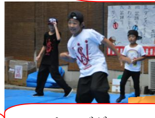
キッズダンス 盛り上がりました！