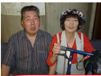
ご家族で参加してくださいました

8月16日は、グリーンヒル恒例行事の納涼会がありました。 今年4月から看板作りに取り組んで下さっていたデイサービスの皆さん。 手作り神輿をお披露目したり、日ごろの頑張りを見ていただく事が出来ました。