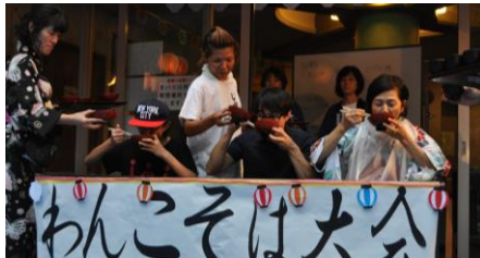
わんこクイーン2連覇です！