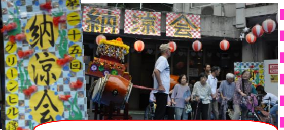
開会式でのお披露目 看板はデイサービス作です！