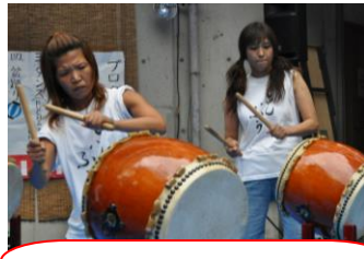
職員による太鼓 カッコ良かったです♪