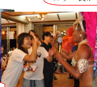
最後はサンバで大盛り上がり☆