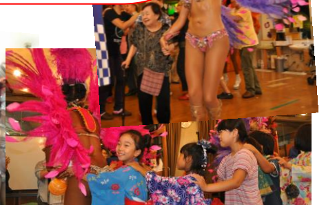
皆で揃ってフィナーレ！